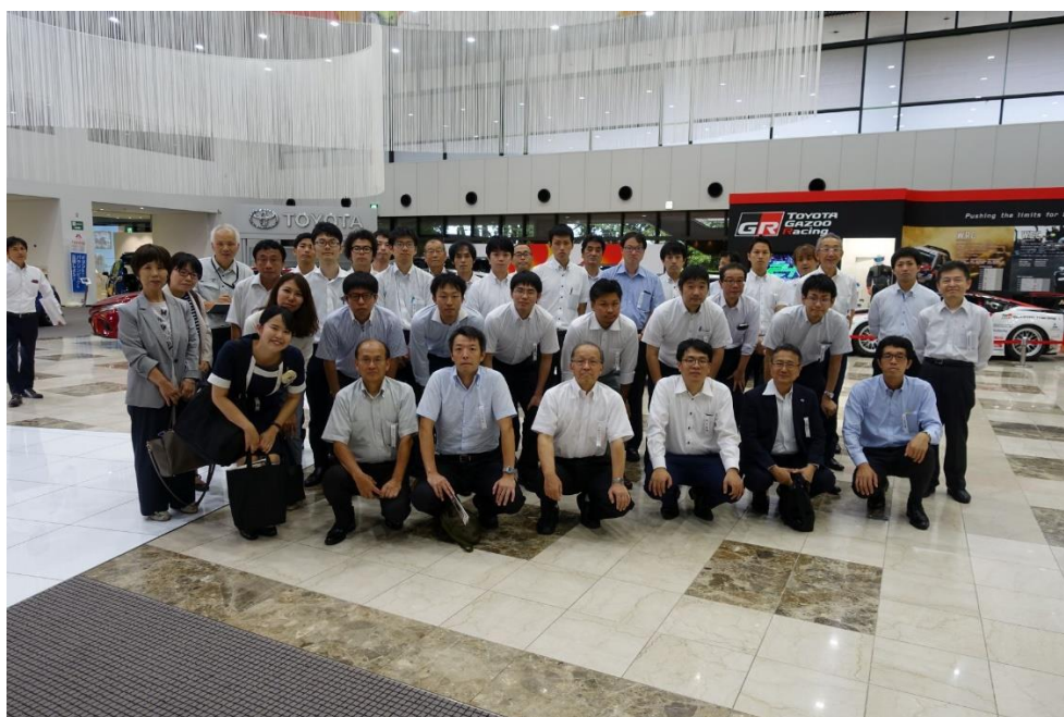
トヨタ自動車(株) トヨタ会館