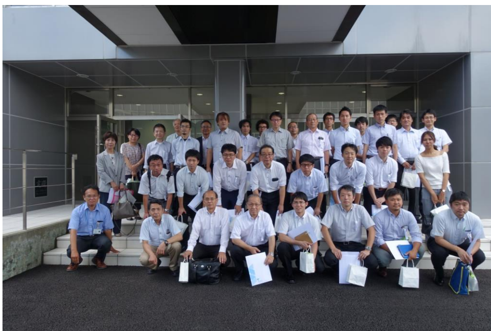
太陽化学(株) 南部工場