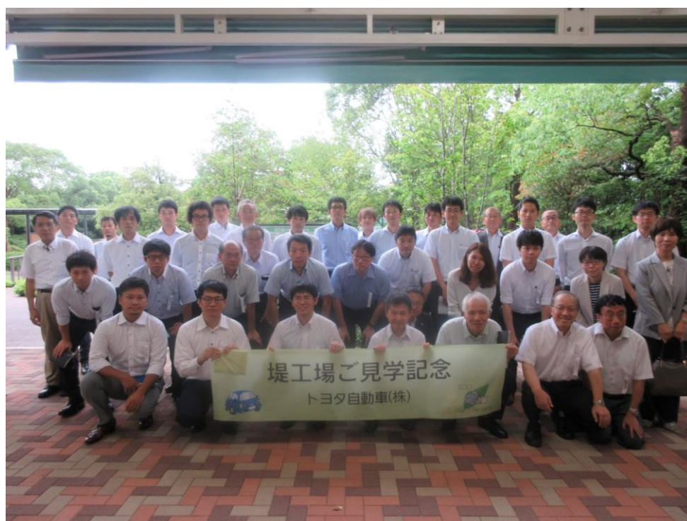
トヨタ自動車（株）堤工場

標記見学と講演会が8月28日（水）～29日（木）に開催され、「名古屋地区に日本の工業をリードする企業を訪ねて」と題し、トヨタ自動車（株）堤工場とトヨタ会館、三洋化成工業（株）名古屋工場、太陽化学（株）南部工場の3社を見学させていただきました。この見学会には33名の方々が参加され、見学先でも活発なご質問があり、各社が有しておられる技術力の高さに感銘を受けました。また、初日の交流会では活発に名刺交換がおこなわれ、和気あいあいとした雰囲気の中、人脈が大きく広がったものと思います。見学先でお世話いただきました関係各位にお礼申し上げます。なお詳細は10月号掲載の見学記をご覧ください。