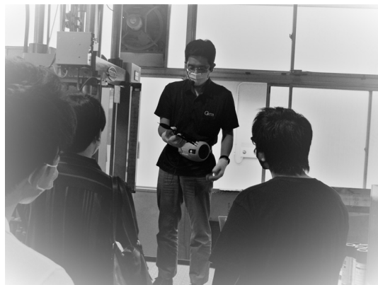
トランスファー成形